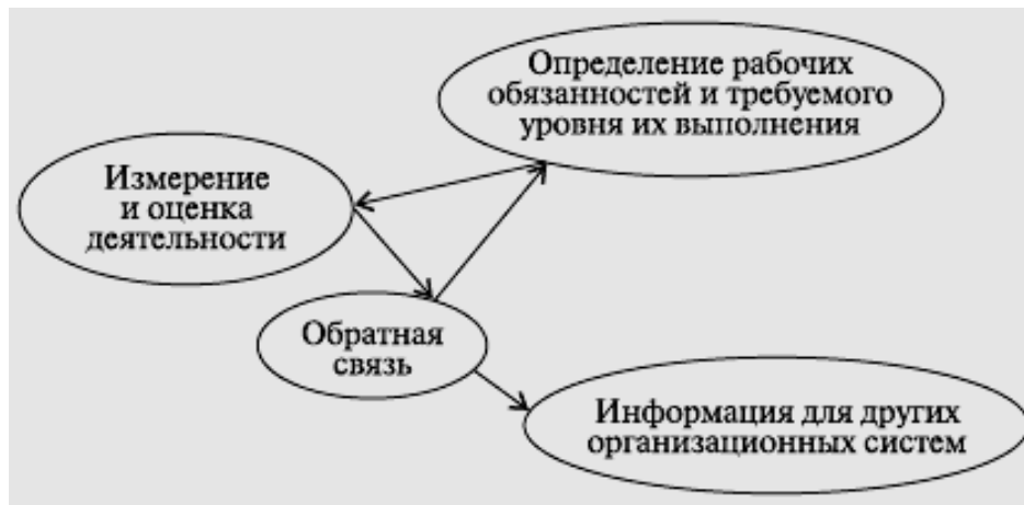
Рис. 1.1. Цикл оценки деятельности работников

Показатели деятельности руководителей подразделений приведены в табл. 1