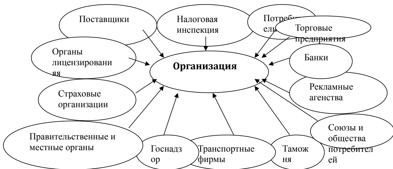
рис.1. Переменные среды прямого воздействия на организацию – организационный атом.

Все факторы прямого воздействия взаимосвязаны и взаимодействуют, поэтому необходимо постоянно отслеживать следующие их общие параметры: