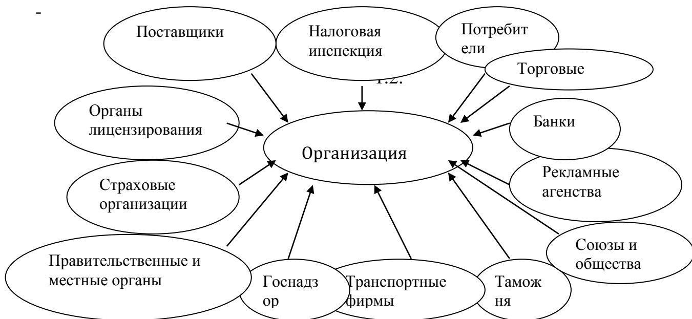
рис.1. Переменные среды прямого воздействия на организацию – организационный атом.

Конкретная часть. Общая характеристика, природа и состав функций менеджмента. Классификация функций менеджмента. Связующие и интеграционные процессы в менеджменте. Основные функции, права и обязанности подразделений среднего предприятия. Внешняя среда характеризуется совокупностью переменных, которые находятся за границами организации. Для простоты анализа переменные внешней среды делятся на среду прямого и косвенного воздействия. Организация представляет некий организационный атом, эффективность деятельности которого напрямую зависит от физических и юридических лиц представленных на рис 1 .