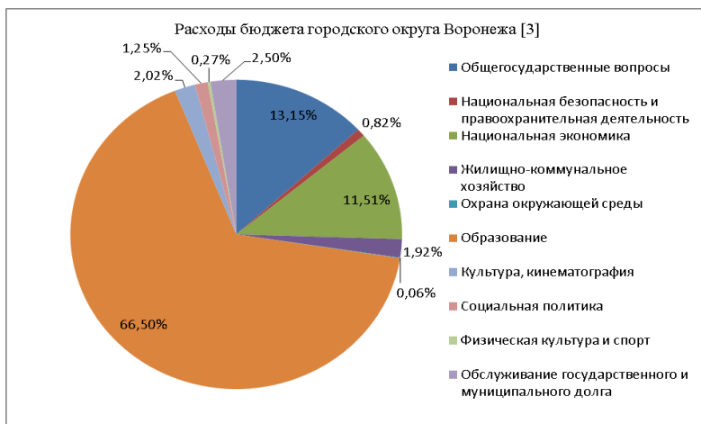
Рисунок 1 – Расходы бюджета городского округа Воронеж