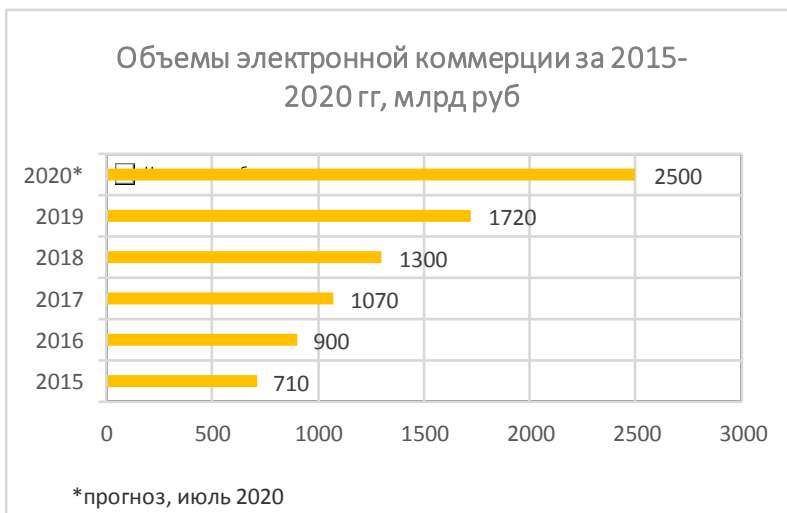
Рисунок 1 - Объемы электронной коммерции за 2015-2020 гг, млрд руб.

Важнейшим элементом интернет-маркетинга является электронная коммерция, т.е. приобретение физических и нефизических товаров и услуг при помощи телекоммуникационных сетей, прежде всего Интернета. Рассмотрим рост электронной коммерции в России за 2015-2020 годы по данным агентства Data Insight (рис.1) [3].